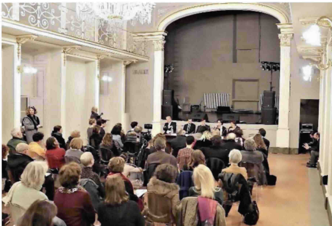
L'interno del Teatro Rinuccini: una delle sue peculiarità è quella di essere dentro al Liceo Machiavelli