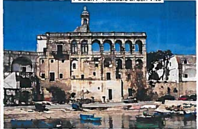
PUGLIA - Abbazia di San Vito