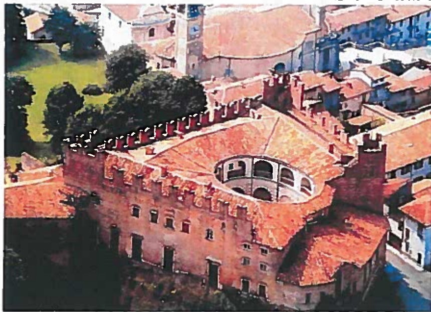
PIEMONTE - Castello di Montemagno