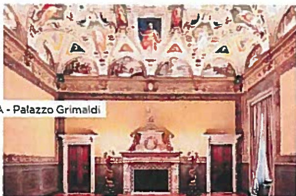
GENOVA - Palazzo Grimaldi

Castelli, ville, masserie e torri fortificate. Sono oltre 31 mila le dimore storiche nel nostro Paese. Un patrimonio unico che lo Stato trascura.