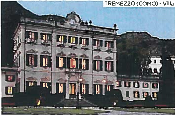
TREMEZZO (COMO) - Villa Cabiati

Serbelloni è la più affascinante dimora del Lago di Como, a Tremezzo. La si può anche affittare per degli eventi.