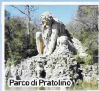
Parco di Pratolino