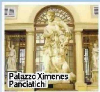
Palazzo Ximenes Panciatichi