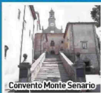
Convento Monte Senario