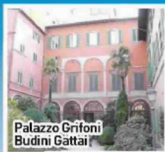
Palazzo Grifoni Budini Gattai