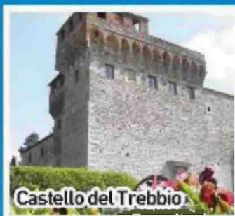
Castello del Trebbio